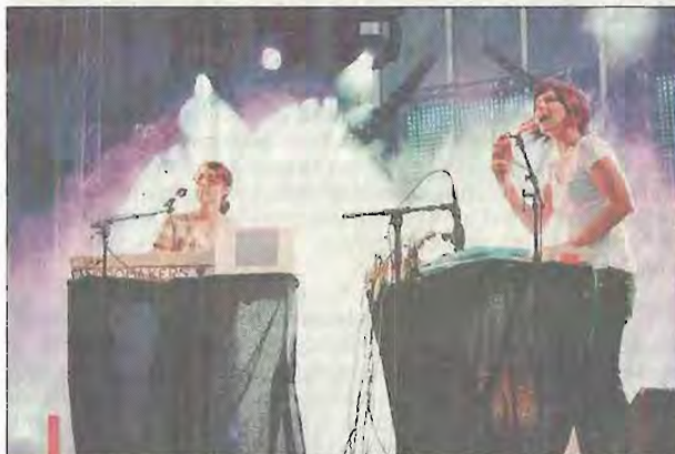
Les Andromakers aixoises qui pourraient toucher le public bien au-delà de la scène underground.

Les deux Aixoises ont ouvert la première soirée dédiée à la musique électro.