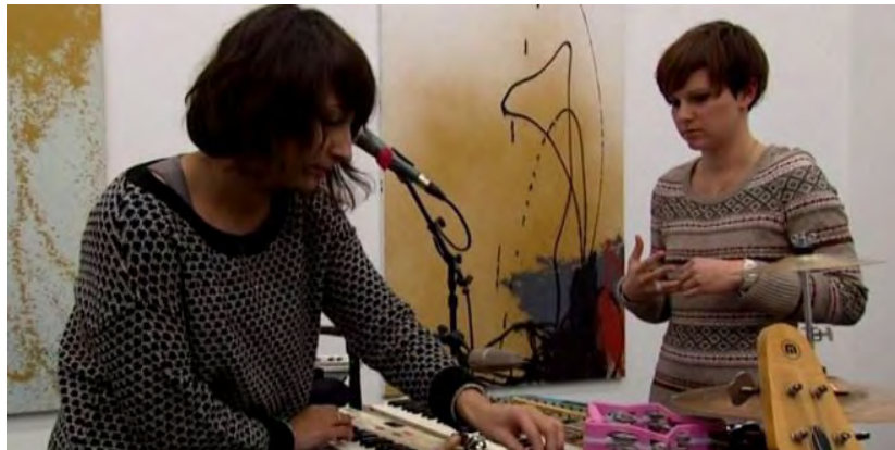
Le duo "Andromakers" en répétition

Publié le 09/01/2013 à 18H02, mis à jour le 10/01/2013 à 17H06