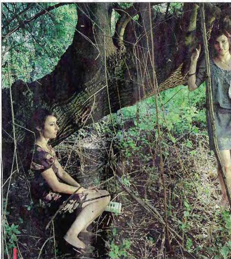
Les Andromakers aiment se mettre au vert pendant l'été.

(En chœur) "L'amour est dans le pré!" pour les chats, les paysages et les animaux. (rires) Solène LANZA